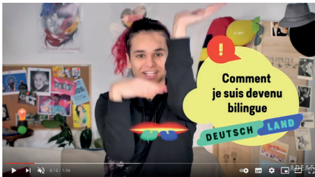
1 - Comment je suis devenu bilingue.

Nous proposons les 5 vidéos à l'unité et également un montage d'un film plus long qui regroupe les 5 vidéos en une seule.