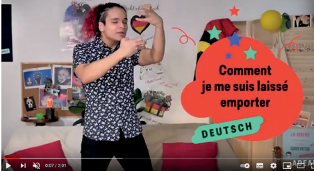
Comment je me suis laissé emporter