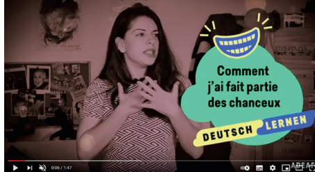
4 - Comment j'ai fait partie des chanceux